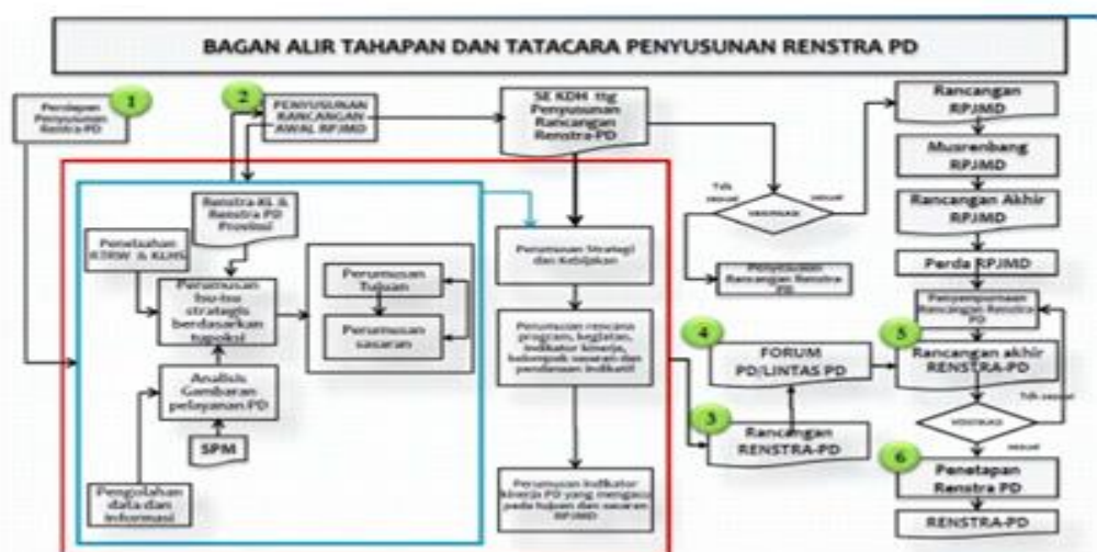
Gambar 1.1 Keterkaitan dan Tahapan Penyusunan Renstra PD Berdasarkan Permendagri Nomor 86 Tahun 2017

Kecamatan Bontoharu yang berada pada arah selatan Kabupaten Kepulauan Selayar, Ibukota Kecamatan terletak di Lingkungan Tangnga-tangnga berkedudukan di Kelurahan Bontobangun, Kondisi tofografi Kecamatan Bontoharu sebagian besar terdiri dari dataran rendah dengan luas wilayah Kecamatan tercatat 128,121 km2